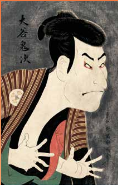
東洲斎写楽《三代目大谷鬼次の奴江戸兵衛》(再現)

東京藝術大学のプロデュースのもと、音や香り・照明などを駆使し、現地の臨場感を再現。展示室内に一步足を踏み入ると、そこは別世界。現地に訪れた気分アジアの美をじっくり堪能してください。