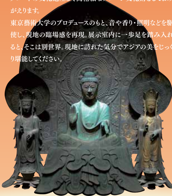
《法隆寺釈迦三尊像》(再現)