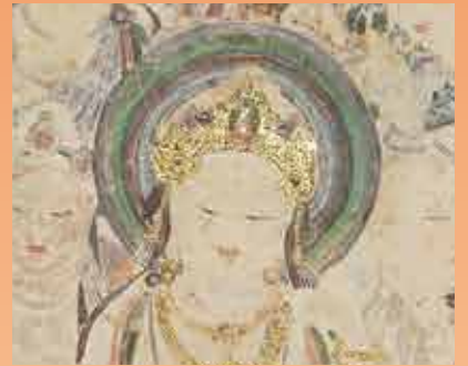
敦煌莫高窟第57窟主室南壁《美人菩薩(通称)》部分(再現)