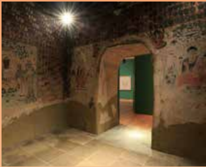
敦煌莫高窟第57窟(再現)