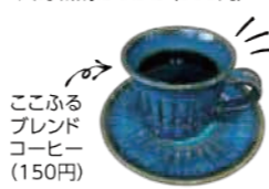
ここふるブレンドコーヒー(150円)