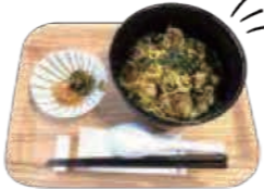
大野城鶏ぽっかけ(500円)

「日替わりランチ」や大野城のソウルフード「大野城鶏ぽっかけ」などを提供しています。また、焙煎世界一の豆香洞コーヒーの豆を使用したコーヒーもありますので、カフェでゆっくりお過ごしください。