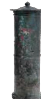
古野遺跡出土経筒 (大野城市)