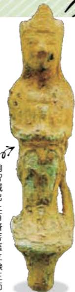
陶智城出土百済吉薩立像正面

大野城市のシンボルでもある水城跡・大野城跡。古代の軍事・信仰上重要な意味を持ち、人々の生活と共に1350年もの時を重ねてきました。「再々発見! 古代山城と水城・大野城」展では、水城・大野城と大野城市の遺跡、そして各地の古代山城をテーマに、大野城の築造から祈りの山、四王寺への変遷、そして現代の最新の調査成果などを展示するとともに、土を運ぶもっこや版築の体験、映像や模型など、様々な角度から古代山城の魅力に迫ります。今に繋がる古代山城の歴史をダイナミックに体験し、あなたも歴史の再々発見をしてみませんか?