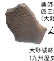
薬師の森遺跡出土 四王銘文字瓦 (大野城市) 大野城跡出土軸摺金具 (九州歴史資料館)