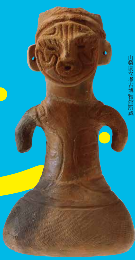
山梨県指定有形文化財 容器形土偶(男・女) 山梨県立考古博物館所蔵