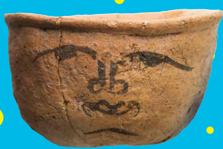
大野城市指定有形文化財 人面墨書土器 福岡県大野城市教育委員会所蔵