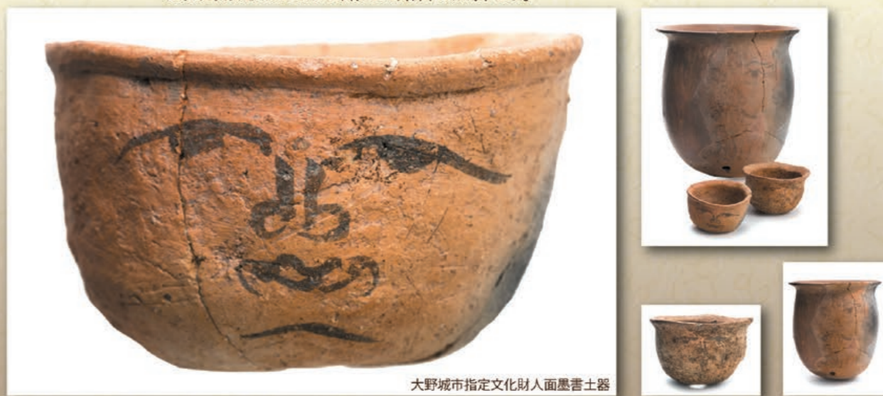
大野城市指定文化財人面墨書土器

会場 大野城心のふるさと館 3階企画展示室 他 ※「3階企画展示室」の観覧には別途観覧料が必要です。 ※大野城心のふるさと館の入館料は無料です。