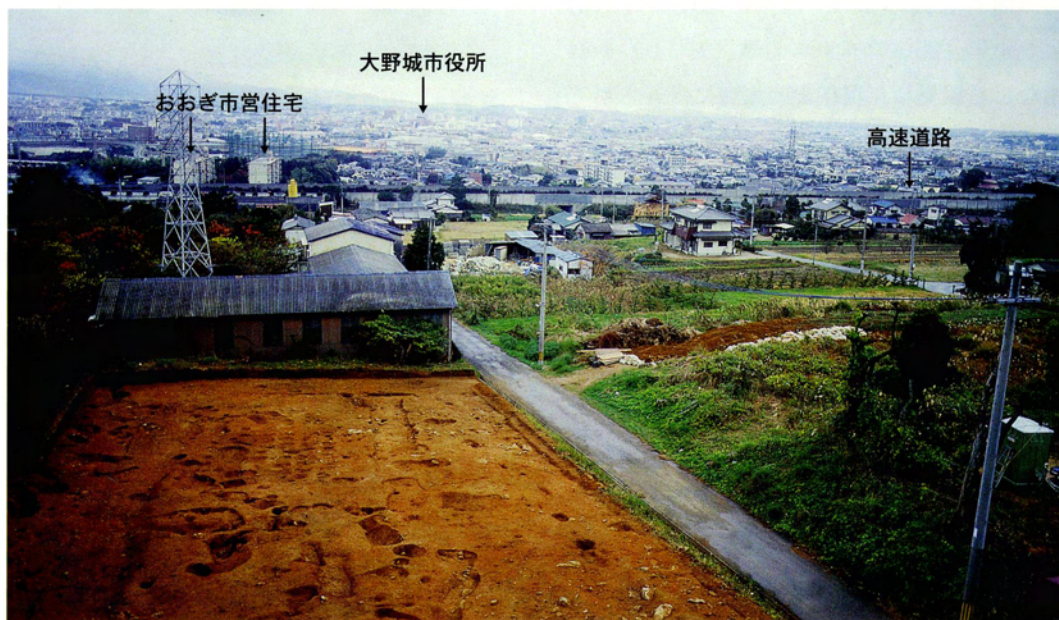
写真1 釜蓋原遺跡から大野城市街地（北東側）を望む