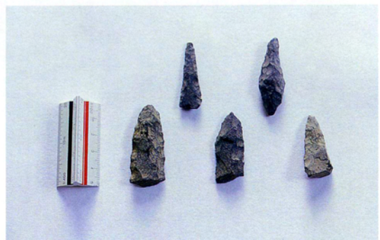
写真3 縄文時代の石槍（中原氏採集）