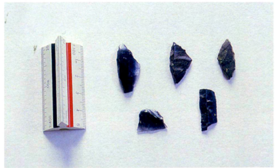
写真2 旧石器時代の石器（中原氏採集）