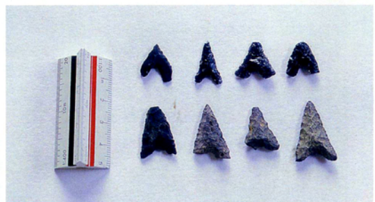
写真4 縄文時代の石鏃（中原氏採集）