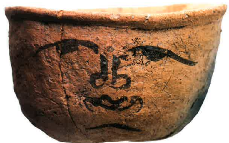
大野城市指定文化財人面墨書土器